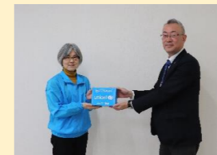
●大山乳業協同組合様 募金贈呈

●お買い物チャリティーとっとり 世界子どもの日寄付キャンペーン おにぎり販売をしている山oka様より 売上の一部を寄付していただきました。