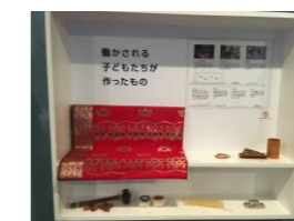
ユニセフハウス展示