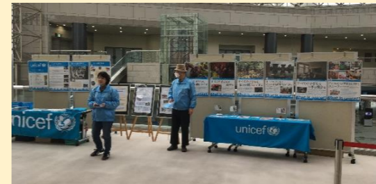
2024/1/20(土) こくみん共済COOP様 ミュージカル公演 ユニセフパネル展、募金活動