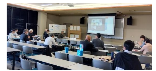
■ 2023/10/16(月) 第20回 役員会