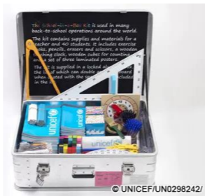
ユニセフ支援物資例「箱の中の学校」