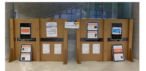
三和段ボール工業(株)様よりパネル台寄贈