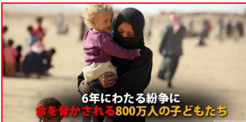
6年にわたる紛争に命を脅かされる800万人の子どもたち