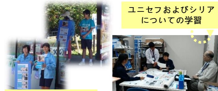
ユニセフおよびシリアについての学習

河原中学校の職場体験「いきいきワークかわはら」で、2年生2名を受け入れました。ボランティアの方も日々事務局に来て、サポートしていただきました。